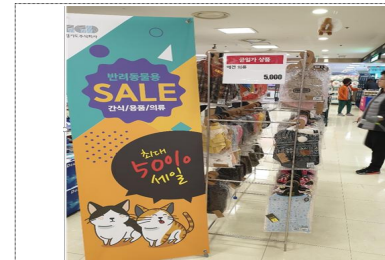
< 대형마트 입점(프로모션 지원) >