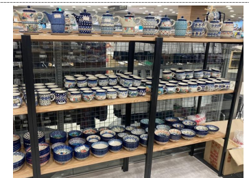
< 대형마트 입점(매대제작 지원) >